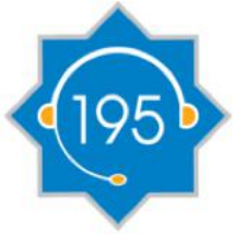
195 Universal Çağrı Mərkəzi