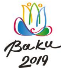
Gənclər Olimpiya Festivalı