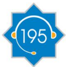
195 Универсальный колл-центр