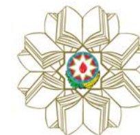
Министерство Образования АР